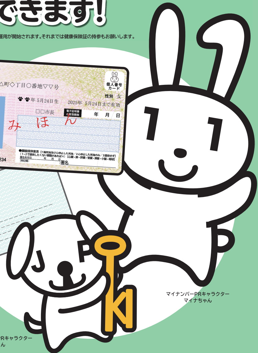
マイナンバーPRキャラクター マイナちゃん