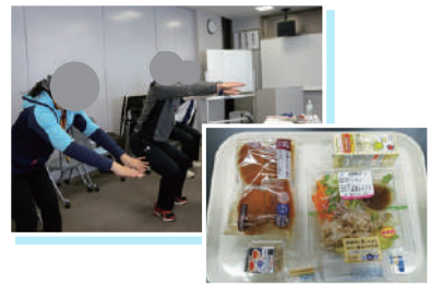
宿泊型糖尿病性腎症重症化予防プログラム(2019年3月実施)