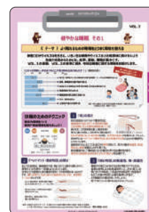
▲ sante INFORMATION